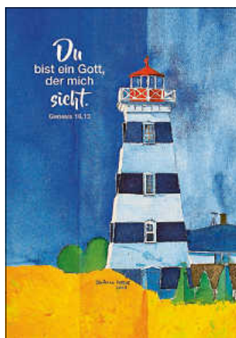
Grafik: Jahreslosung 2023 - Friese