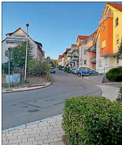
Eine Durchfahrt von „unten“ ist künftig nicht mehr erlaubt

Seit dieser Woche ist der Forchenweg als Einbahnstraße ausgewiesen und darf nur aus Richtung Tannenweg befahren werden. Gleichzeitig werden von der Gemeinde an neuralgischen Stellen Pflanztröge aufgestellt, damit gegenüberliegende Einfahrtsbereiche von Garagen und Grundstücke nicht zugeparkt werden. Bewährt sich diese Lösung, haben wir in Absprache mit Landratsamt und Gemeinderat vor, auch weitere Straßenzüge auf diese Weise zu „begrünen“ und verbessern so sicher auch das Kleinklima!