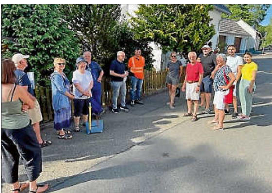
Mit den Anwohnern wurden die Regelungen besprochen. Auch Geschwindigkeitskontrollen sollen stattfinden