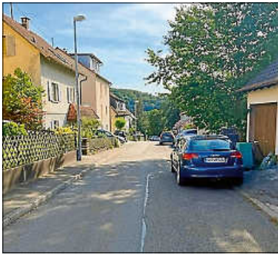
Richtung Neue Mitte bleibt der Forchenweg weiter befahrbar. Pflanztröge sorgen für die Unterbrechung der Parkreihe

Schon seit Jahren werden die Diskussionen geführt, wie der Verkehr im Forchenweg entlastet werden kann. Zum einen beschäftigt Anwohner und Gemeinde die enge Parksituation. Der Durchgangsverkehr ist vielen zu schnell, da auch der Forchenweg als Schulweg dient. Insgesamt ist die historische Straße zu eng, der schmale Gehweg kaum ausreichend und die Einfahrt auf die privaten Grundstücke oft nur schwer oder kaum