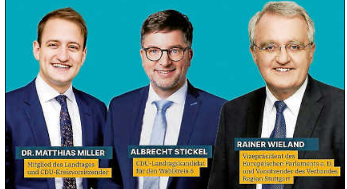
Plakat: CDU Grafenau

01. Februar 2026 11.00 Uhr Schloss Dätzingen