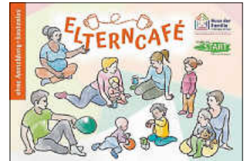
Grafik: Ev. KG

9.30 Uhr Elterncafé für Schwangere, Eltern und Kinder von 0 bis 3 Jahren ( ACHTUNG , neuer Ort: ev. Gemeindehaus Dätzingen)