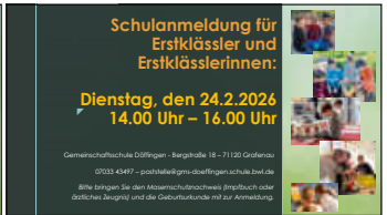
Flyer: Verena Theimel