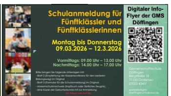
Flyer: Verena Theimel