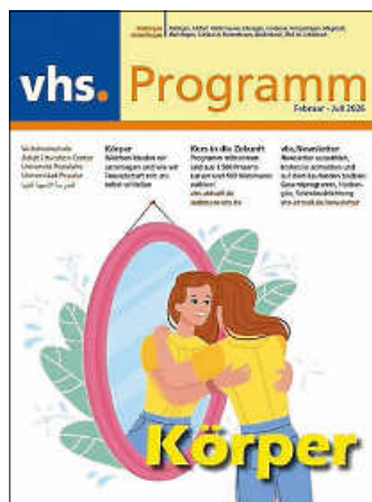
Plakat: vhs. Böblingen-Sindelfingen

Auslagestellen sind alle SB-Filialen der Kreissparkasse und der Volks- und Raiffeisenbanken, das breuningerLAND Sindelfingen, die MERCADEN in Böblingen, Banken, Buchhandlungen, Rathäuser und alle 13 vhs-Standorte. Für das Sommersemester stehen 1.500 Kurse sowie 800 Webinare zur Auswahl. Semesterstart für die Präsenzkurse ist am 23. Februar.