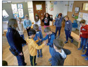
Gewinnen durch Nachgeben? Möglich!

Dann spielten wir ein Gleichgewichtsspiel und stellten dabei fest, dass Schiedsrichter es gar nicht leicht haben, fair zu urteilen und immer konzentriert zu bleiben.