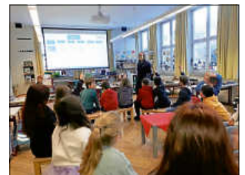
Wo brauchen wir Regeln?

Frau Henschke erklärte uns auch noch Regeln für einen fairen Streit. So ist neben dem Sich-Entschuldigen auch das Verzeihen wichtig.