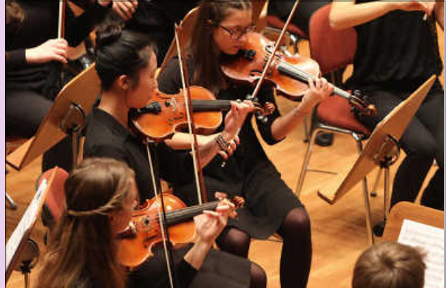
Streicher Tübinger Musikschule