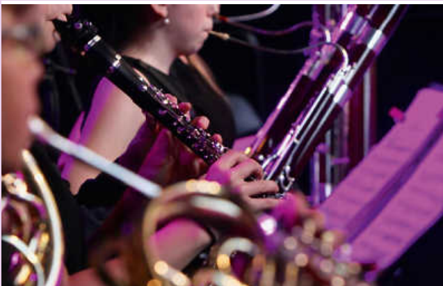
Bläser Tübinger Musikschule

Ihr Kulturkreis Grafenau – Arbeitskreis Konzerte