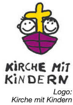
Logo: Kirche mit Kindern

ev. Gemeindehaus Dätzingen 10.30 Uhr die Kinderkirche Dätzingen startet heute wieder! - Euer Kiki-Team Dätzingen freut sich auf Euch!