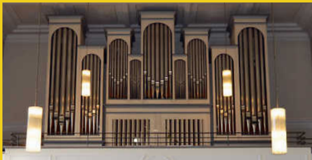
Design: Christina Piegsa